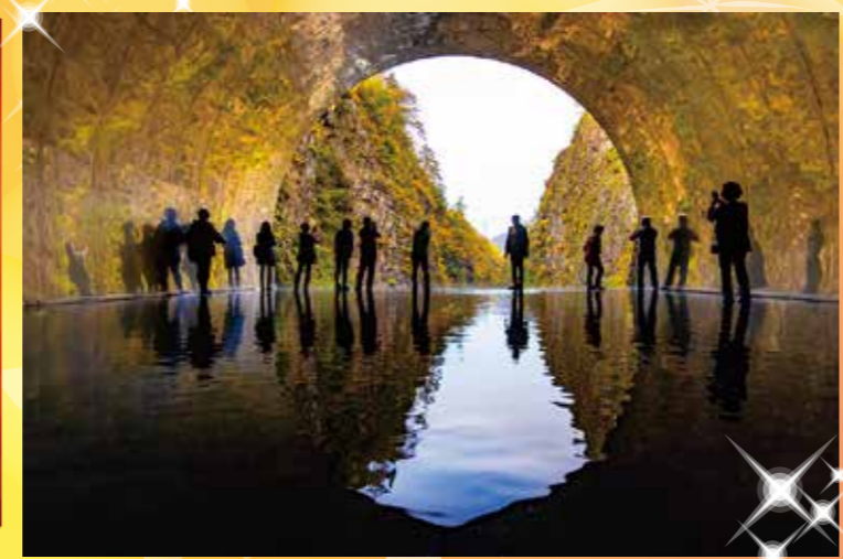
今話題のインスタ映えスポット