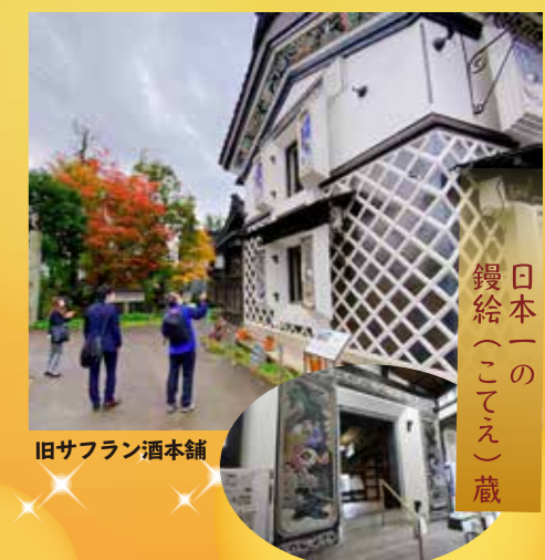
日本一の 鍔絵(こてえ)蔵 旧サフラン酒本舗

Resort Bank 1泊2日モデルコース 1日目 各地発→(JR) 越後湯沢駅 (10:00)→(湯沢IC～小千谷IC) 【初登場】小千谷豪商の館・西脇邸 (30分) (小千谷市)→老舗の料亭で昼食「東忠」→長岡もみじ園 (長岡市) (45分) →醸造のまち撰田屋 (長岡市) 観光ガイド同行で散策 (80分)・越のむらさき・酒ミュージアム醸蔵・旧サフラン酒本舗・発酵ミュージアム米蔵など →道の駅ながおか花火館 (長岡市) (30分)→松雲山荘 (柏崎市)→もみじのライトアップをご鑑賞 (60分)→岩室温泉 (泊) めんめん亭わたや 2日目 岩室温泉 出発 (8:00)→弥彦公園もみじ谷 (45分)→弥彦神社参拝・弥彦菊まつり開催 (30分)→弥彦ロープウェイ～山頂 (50分) →(弥彦スカイライン)→極み寿司の昼食「だいらの湯」(50分)→(三条燕IC～塩沢石打IC) 日本三大渓谷「清津峡」(60分) →越後湯沢駅→(JR) 東京駅