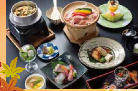
お泊りは…岩室温泉 めんめん亭わたや

Resort Bank 1泊2日モデルコース 1日目 各地発→(JR) 越後湯沢駅 (10:00)→(湯沢IC～小千谷IC) 【初登場】小千谷豪商の館・西脇邸 (30分) (小千谷市)→老舗の料亭で昼食「東忠」→長岡もみじ園 (長岡市) (45分) →醸造のまち撰田屋 (長岡市) 観光ガイド同行で散策 (80分)・越のむらさき・酒ミュージアム醸蔵・旧サフラン酒本舗・発酵ミュージアム米蔵など →道の駅ながおか花火館 (長岡市) (30分)→松雲山荘 (柏崎市)→もみじのライトアップをご鑑賞 (60分)→岩室温泉 (泊) めんめん亭わたや 2日目 岩室温泉 出発 (8:00)→弥彦公園もみじ谷 (45分)→弥彦神社参拝・弥彦菊まつり開催 (30分)→弥彦ロープウェイ～山頂 (50分) →(弥彦スカイライン)→極み寿司の昼食「だいらの湯」(50分)→(三条燕IC～塩沢石打IC) 日本三大渓谷「清津峡」(60分) →越後湯沢駅→(JR) 東京駅