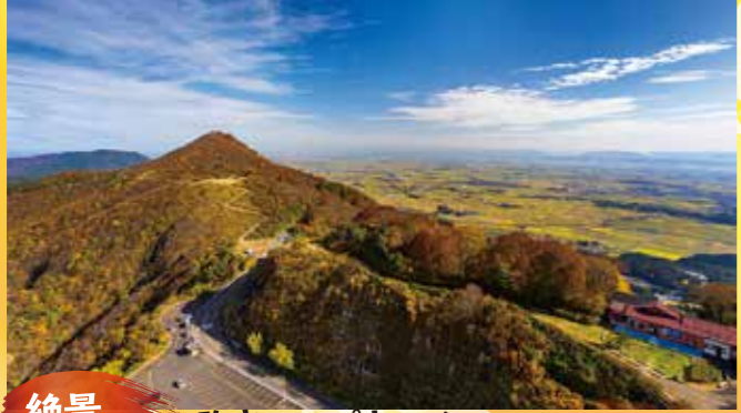
絶景 弥彦ロープウェイ