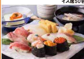
100畳の大宴会場と52畳の中宴会場があります。新湯すし三昧「極み」のご提供もできます。