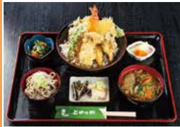
自家製のそばやコシヒカリとともに魚沼の郷土料理を味わうことができます。