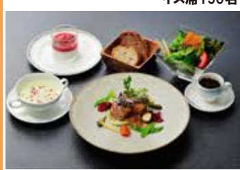
本格的なホテルの味をご用意。優雅なランチをお楽しみください。洋食・和食対応可能です。