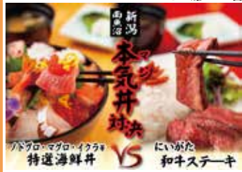
新湯 本気丼対決 パパロ・マゴロ・イクタ VS にいがた 和牛ステーキ 越後三山の眺望と選べる本気(マジ)丼「特選海鮮丼or新湯和牛ステーキ丼」