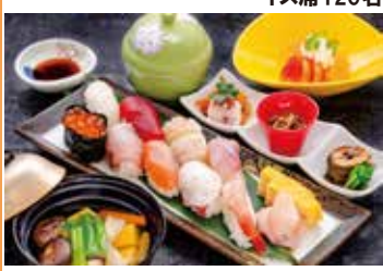
料理自慢の割烹旅館で味わう、創作料理。