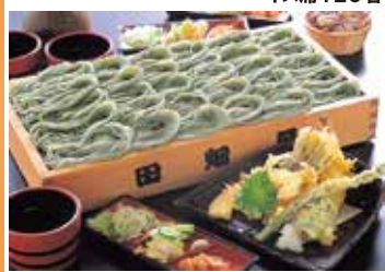
コシのあるなめらかなのどごしが特徴。つなぎに布海苔を使った塩沢そばです！