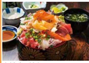
大人気店で味わう「海鮮ごぼれ落ち本気(マジ)丼」