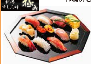
新湯すし三昧「極み」。特上にぎり10カン。新湯でしか味わえない地魚の美味しさを堪能！