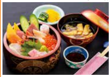
和食・洋食や本格的な幕の内弁当まで様々なメニューがございます。魚沼産コシヒカリを使用。