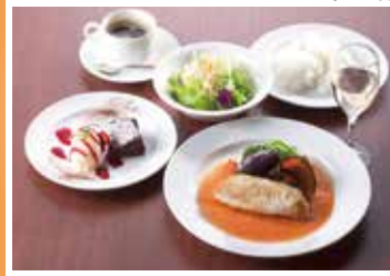
おいしいワインと、地元で獲れた新鮮な食材を使ったメニューです。 ※水曜日定休日