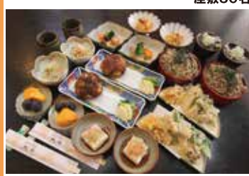
古民家で、太し柱と梁が立派な豪雪地作りです。郷土料理や自家製手作り豆腐が評判の人気店。