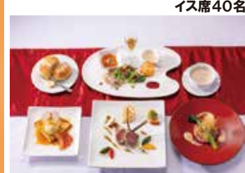
泉の森に佇む癒しのオーベルジュで欧風創作料理をご堪能ください。