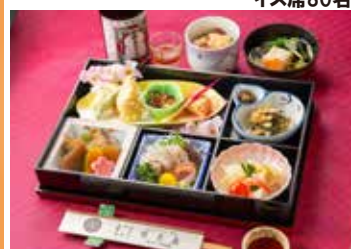
長岡野菜など地元野菜と厳選仕入れの鮮魚を活かした品々をごゆっくりと味わい頂けます。