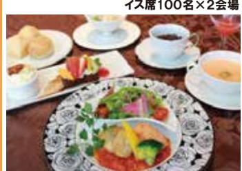
イングリッシュガーデンに隣接するホテルでラグジュアリーな空間と美味しい料理が楽しめます。