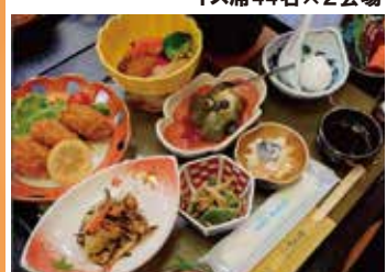
地元の旬の食材をいかした田舎料理。