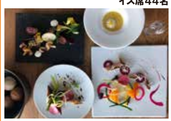
築85年の木造小学校舎をリノベーションした施設。ゆっくりとした雰囲気の中で、贅沢な時間が過ごせるレストラン