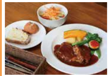
洋食。トロトロに煮込まれた妻有ポークと自家製デミグラスソースは絶品です。