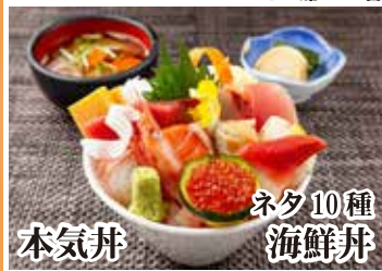
本気丼 ネタ10種 海鮮丼 季節ごとに変化する景色を楽しみながら高原リゾートホテルでゆったりランチ。